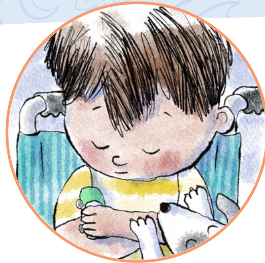
Il fait une prière pour qu'elle aille mieux.