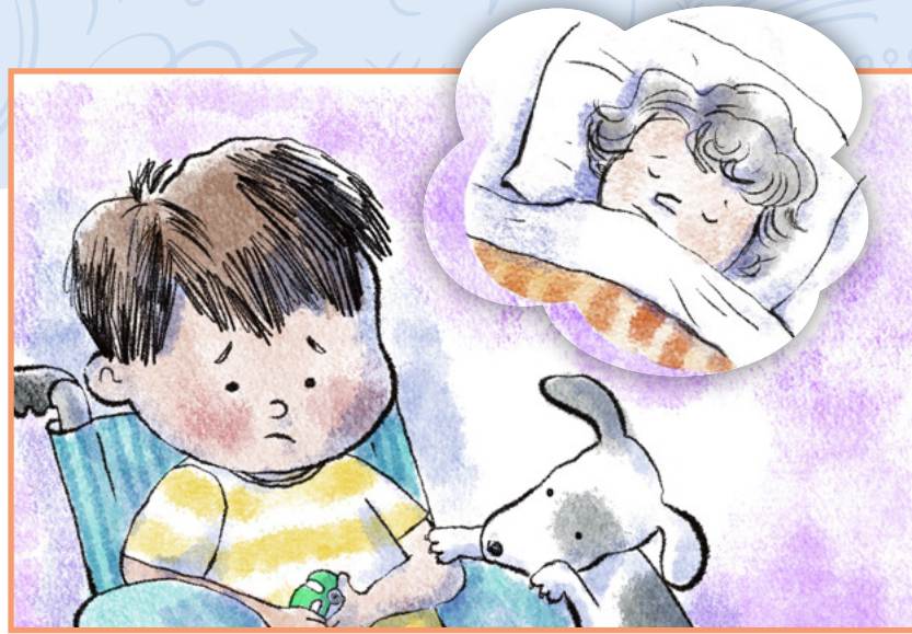
La grand-mère d'Ethan est malade.

Colorie les cœurs de ce mot ! À qui peux-tu l'envoyer ?