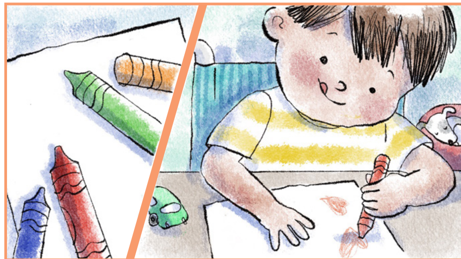
Il va chercher ses crayons de couleur et une feuille de papier et confectionne une jolie carte pour elle.