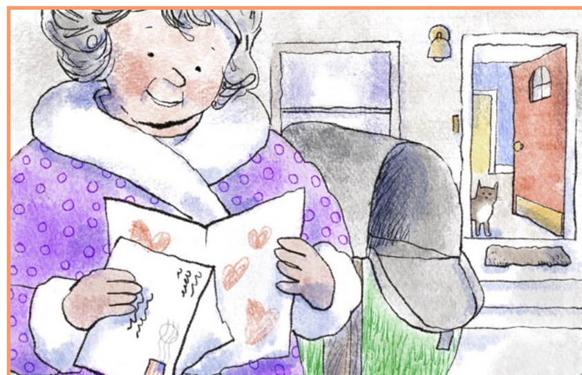
La grand-mère d'Ethan est très contente de sa carte !