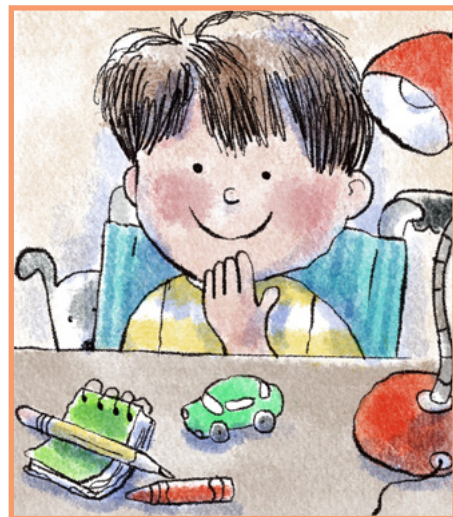
Il a alors une idée !