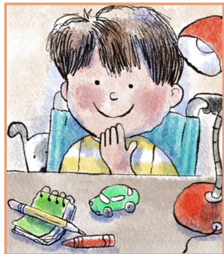
А потом ему в голову приходит идея!