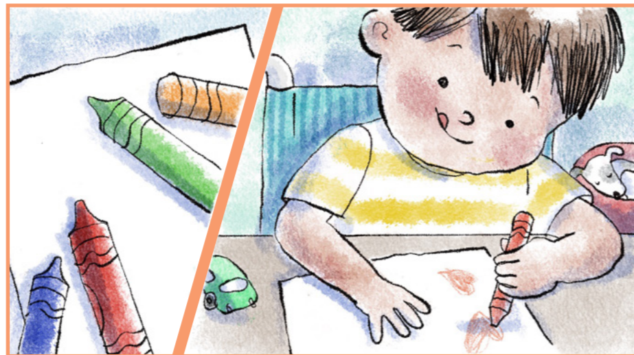
Он берет восковые мелки и бумагу и рисует для нее веселую открытку.