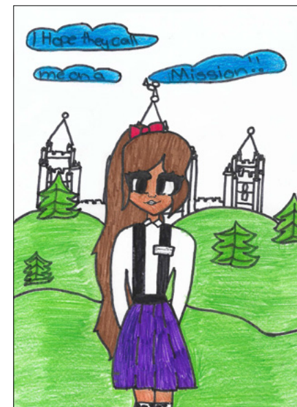
"Я прагну стати місіонером," Саманта Ф., 10 років, Новий Південний Уельс, Австралія