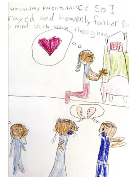
Мої батьки розлучилися. Я молилася про втіху, і мене сповнили заспокійливі думки. Айка С., 7 років, шт. Айдахо, США