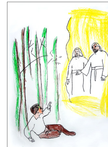
Далма Е., 6 років, Санта-Фе, Аргентина