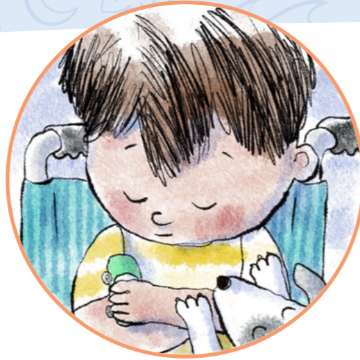
Він молиться за неї, щоб їй стало краще.