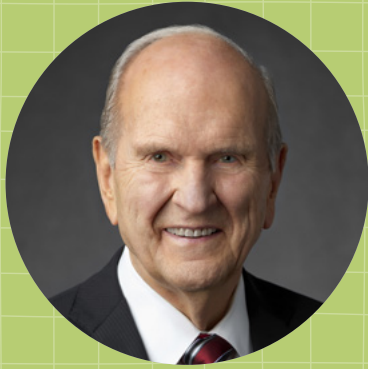
Presidente Russell M. Nelson