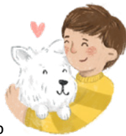
Забота о животных