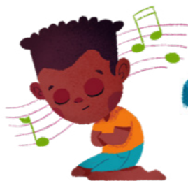
У Аны есть любимая песня Первоначального общества – «Детская молитва».

«Куда вы хотите направить меня служить?»