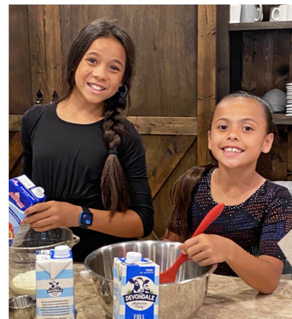
Eta (anbwijmaroñ) ej iiōk ippān lio jein, Talai.

Eta ej ba, "Em̄man ippa ajiji ippān ro jet kōnke ej kōm̄man aer m̄ōñōñō, im ej kōm̄man aō m̄ōñōñō. Ijeļā bwe ej ta eo Jemedwōj Ilañ ej kōñaan bwe kōmin kōm̄mane." ●