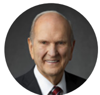
Presidente Russell M. Nelson

Há muitos anos, fui a uma reunião com outros médicos em uma cidadezinha no México. Certa noite, um dos médicos ficou muito doente.