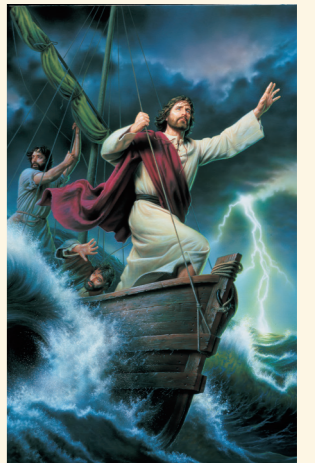
HISTÓRIA SOBRE JESUS: Quando Ele acalmou o mar

LUGAR: Virgínia, EUA, e Hersheypark na Pensilvânia, EUA