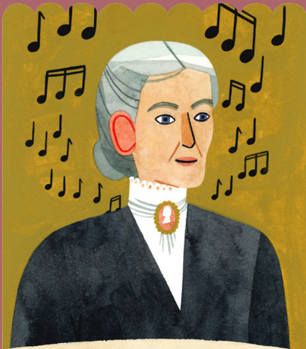
AURELIA SPENCER ROGERS