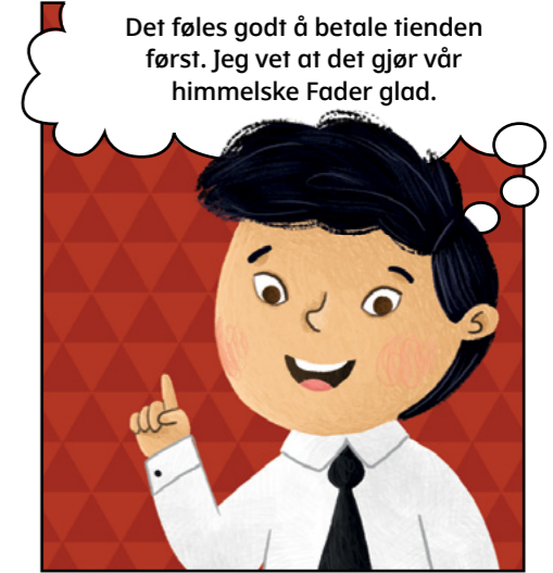
Denne historien fant sted i Taiwan. Kinesisk nyttår er 1. februar neste år!

Det føles godt å betale tienden først. Jeg vet at det gjør vår himmelske Fader glad.