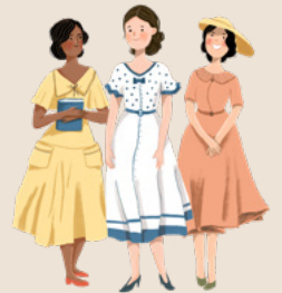
她後來成為初級會會長。