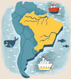
巴西是南美洲最大的國家。