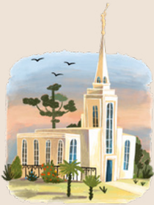
巴西有七座聖殿，很快會再增加兩座。

奧 嘉難過地說：「我想念分會裡的每一個人。」又一次，他們家是唯一出席主日學的人。