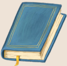
摩爾門經是在第二次世界大戰期間翻譯成葡萄牙文的。