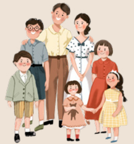
奧嘉結了婚，有五個孩子。