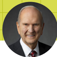
Præsident Russell M. Nelson

M ine kære unge venner, jeg elsker jer! Når jeg ser jer, tænker jeg på mine oldebørn. Ved I, at i min familie har vi mere end 100 oldebørn under 12 år? De er kloge og meget dyrebare, ligesom I er.