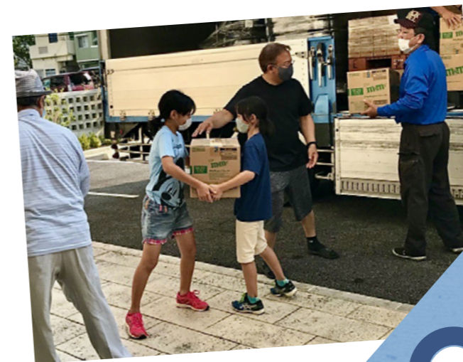
Ami fulgte Jesus ved å hjelpe folk som var sultne. Bla om for å lese en historie om hvordan Jesus hjalp andre.

Ami satte sammen pappesker. Når eskene var fulle av mat, lukket hun dem slik at de kunne bli teipet igjen. Ami tenkte stadig på at Jesus ga folk brød og fisk. Hun var glad for å kunne hjelpe til med å gi mat til sultne mennesker slik han gjorde. ●