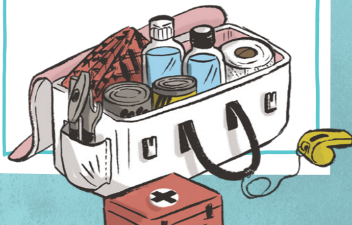
イラスト：ケイティ・トックリル

活動：緊急時の計画を立てましょう。家族が緊急時にそなえる方法について話し合しましょう。まずは今日、何ができるでしょうか。