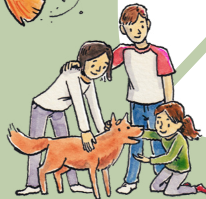
ภาพประกอบโดย ทอริช เค็กเนิร์ท