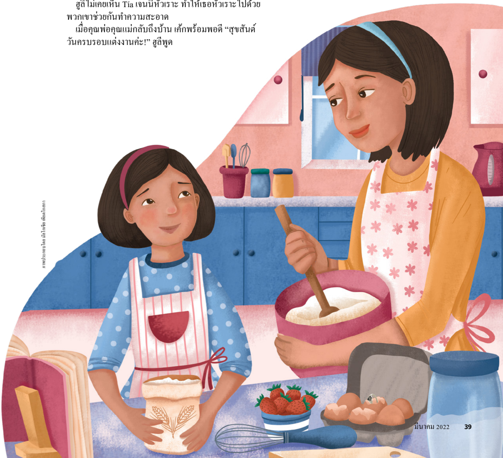
ภาพประกอบโดย มิลาโกเชวิช เพ็ชร์โกดากา

“ขอบใจจ๊ะ! เด็กที่น่ากินมาก ลูกทำเองหรือ?” คุณแม่ถาม “เปล่าค่ะ Tía เจนนี่กับหนูทำด้วยกัน” สตึกล่าว เธอยิ้มให้ Tía เจนนี่ และครั้งนี้ Tía เจนนี่ยิ้มตอบ! ความรู้สึกอบอุ่นแผ่ซ่านในใจสตึ เธอดีใจที่พระบิดาบนสวรรค์ทรงตอบคำสวดอ้อนวอนของเธอ ●