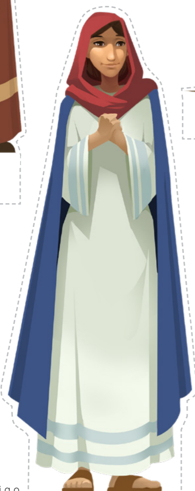
Maria, mãe de Jesus