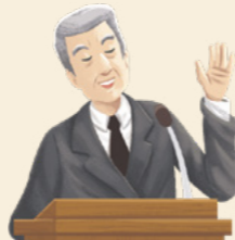
Dieter agora é um dos Doze Apóstolos — o élder Dieter F. Uchtdorf!