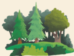
Um terço da Alemanha é coberto por florestas.