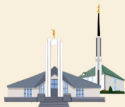
Há dois templos na Alemanha.