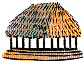
Et tradisjonelt hus på Samoa, kalt fale, har ingen vegger.