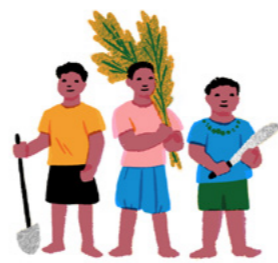
Toms landsby Sauniatu ble bygget av en gruppe siste dagers hellige.