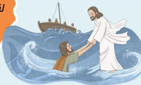
ដំណើររឿងអំពីព្រះយេស៊ូវ ៖ នៅពេលទ្រង់បានជួយពេទ្រសព្វដើរនៅលើទឹក