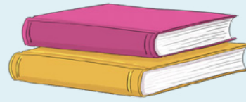
មុខវិជ្ជានៅសាលា ៖ អង់គ្លេស និងប្រវត្តិសាស្ត្រ