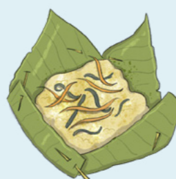
អាហារ ៖ អាម៉ុក ( ត្រីចម្អិនក្នុងស្លឹកចេក )