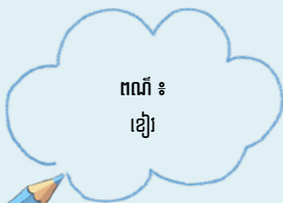
ពណ៌ ៖ ខៀវ