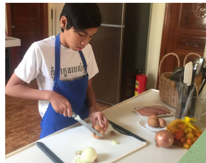
HÌNH ẢNH MINH HỌA DO LISA HUNT THỰC HIỆN

Septream nói rằng chúng ta được ban phước khi phục vụ người khác. "Khi chúng ta làm điều gì đó tốt lành, Thượng Đế sẽ ban phước cho chúng ta. Chúa Giê Su phán rằng làm điều tốt cho người khác thì giống như làm điều tốt cho Ngài vậy."