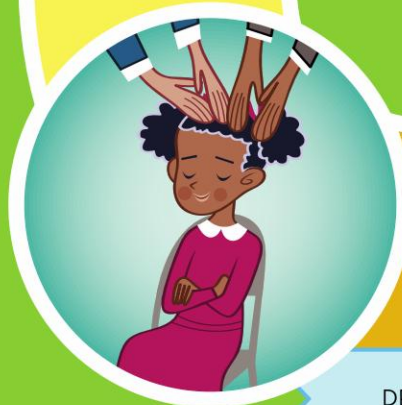
DEN HELLIGE ÅNDS GAVE

Nadverden – ukentlig fornyelse av dåpens pakt