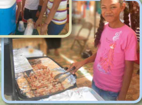
Min mor og tante besluttede sig for at starte et familieprojekt for at indsamle penge, så alle vi fætre og kusiner en dag kan tage på mission. Vi laver kyllingekebabber og 'otai, som vi sælger på markedspladsen hver lørdag.