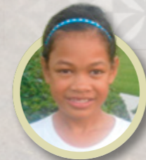
Jeg vil gerne gå på universitetet og blive seminarlærer ligesom min mor. Jeg vil også gerne tjene som missionær og blive gift i templet. Men indtil da nyder jeg bare at bo på en smuk paradiso.