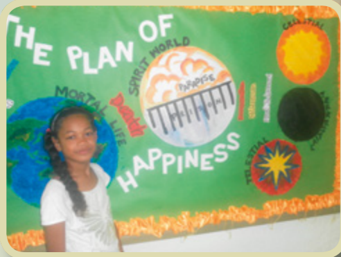
Jeg kan lide at danse, lave sportsaktiviteter og male. Jeg hjalp med at lave et vægmaleri om frelsesplanen på seminarbygningen.