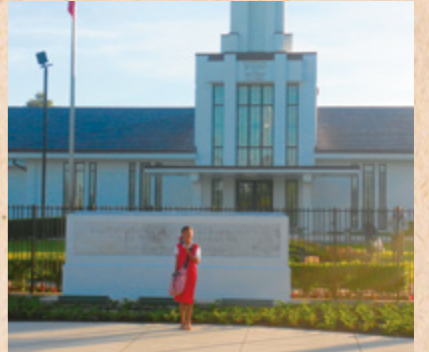
Når vi er på vej til skole, går min familie forbi templet. Jeg føler fred, når jeg ser templet. Jeg kan slet ikke vente, til jeg kan komme indenfor en dag.