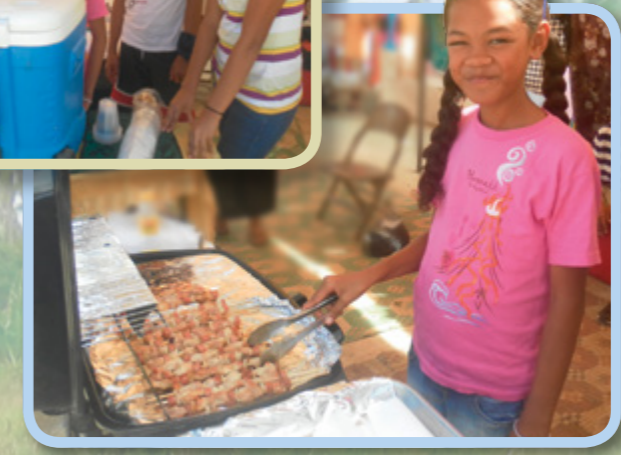
La mamma e la zia hanno deciso di avviare un progetto di famiglia per guadagnare i soldi che un giorno tutti noi cugini useremo per andare in missione. Facciamo spiedini di pollo e 'otai e li vendiamo al mercato dei contadini ogni sabato.