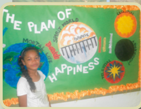
Mi piace ballare, fare sport e dipingere. Ho aiutato a fare un murales sul piano di salvezza sull'edificio del Seminario.