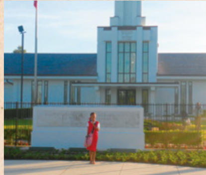
Når vi går til skolen, går vi forbi templet. Jeg føler fred når jeg ser templet. Jeg gleder meg sånn til å komme inn en dag.