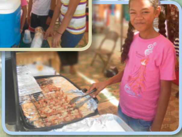
Mamma og tante bestemte seg for å starte et familjeprosjekt for å tjene penger så alle vi søskenbarna kunne dra på misjon en dag. Vi lager kylling kebab og 'otai som vi selger på markedet hver lørdag.