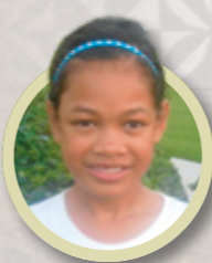
Jeg ønsker å studere ved universitetet og bli Seminar-lærer som mamma. Jeg vil også dra på misjon og gifte meg i templet. Men i mellomtiden vil jeg bare nyte livet på et vakkert øyparadis.