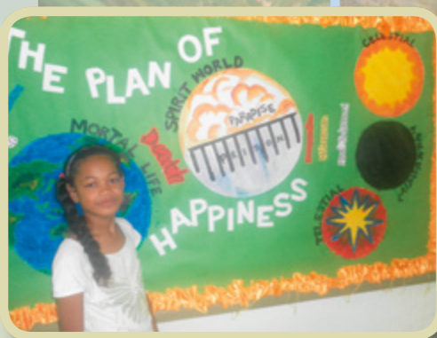
Jeg liker å danse, drive sport og male. Jeg hjalp til med å lage et veggmaleri om frelsesplanen til Seminar-bygningen.