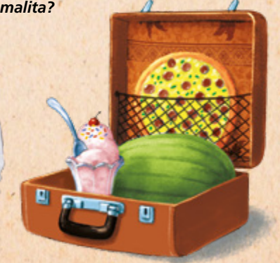
Ang malita ni Kaloni naimpaki na uban sa iyang paborito nga mga butang. Asa niining mga butang ang imong isulod sa imong malita?