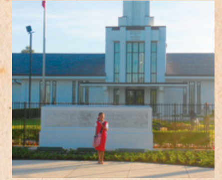
Sa among paglakaw paingon sa eskwelahan, ang akong pamilya moagi sa templo. Mobati ko og kalinaw kon sa makakita sa templo. Dili ko makahulat hangtud nga ako makasulod sa umaabut nga adlaw.