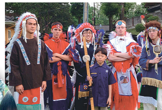
Soy ciudadano tanto de los Estados Unidos como de Corea del Sur, así que formo parte del programa de la Iglesia de los Boy Scouts de América.