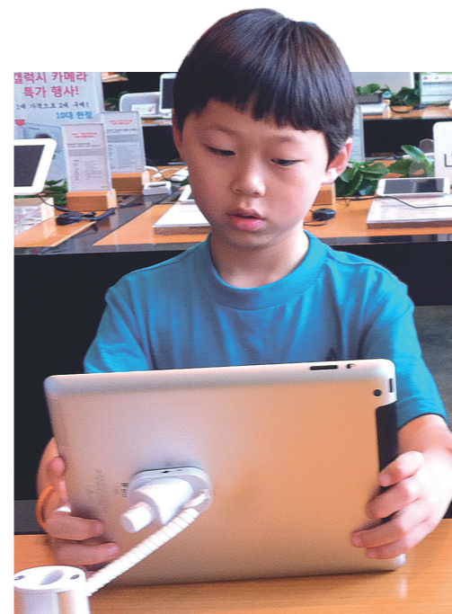
Me gusta leer. Soy bilingüe, lo cual significa que sé leer, escribir y hablar coreano e inglés.