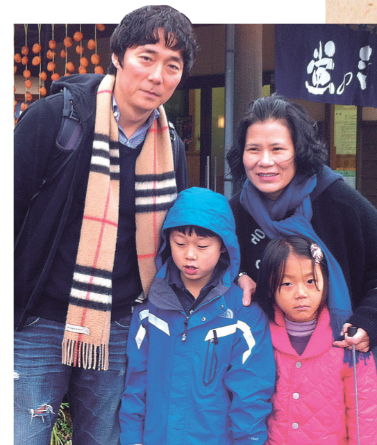
Chuseok é um de nossos feriados mais importantes. É a comemoração da colheita: um dia de ação de graças coreano.

A mala de Luca está feita com algumas de suas coisas favoritas. Quais dessas coisas você colocaria em sua mala?