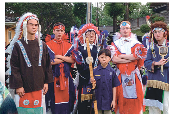
Sou cidadão tanto dos Estados Unidos quanto da Coreia do Sul, por isso participo do programa dos Escoteiros da América na Igreja.