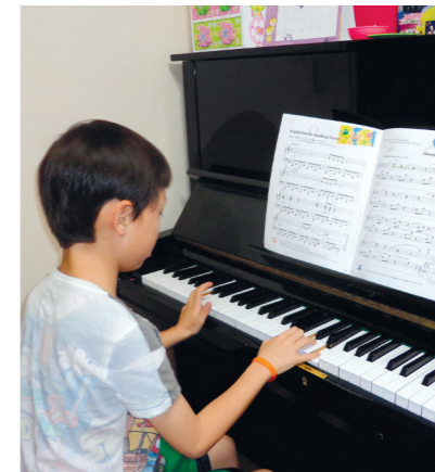
Vou para a escola das 8 horas e 30 minutos da manhã até às 2 horas e 30 minutos da tarde. Depois das aulas, vou para uma academia chamada hak-won para estudar outras coisas. Também estudo piano e arte.