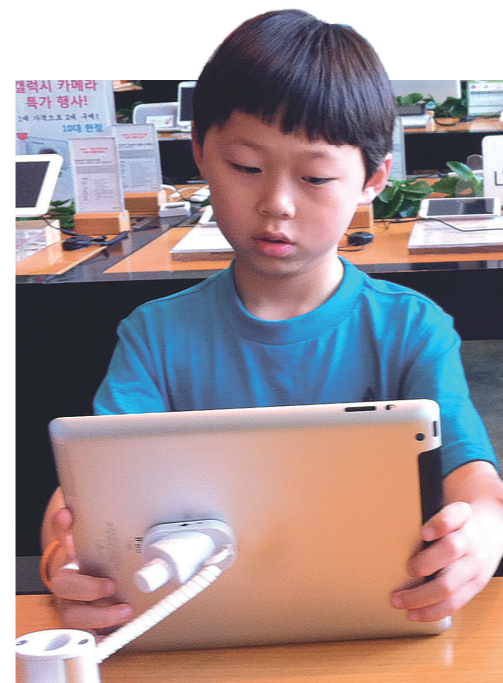
Gosto de ler. Sei falar duas línguas, ou seja, sei ler, escrever e falar tanto em coreano quanto em inglês.