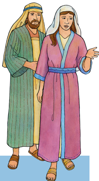
Maria och Josef