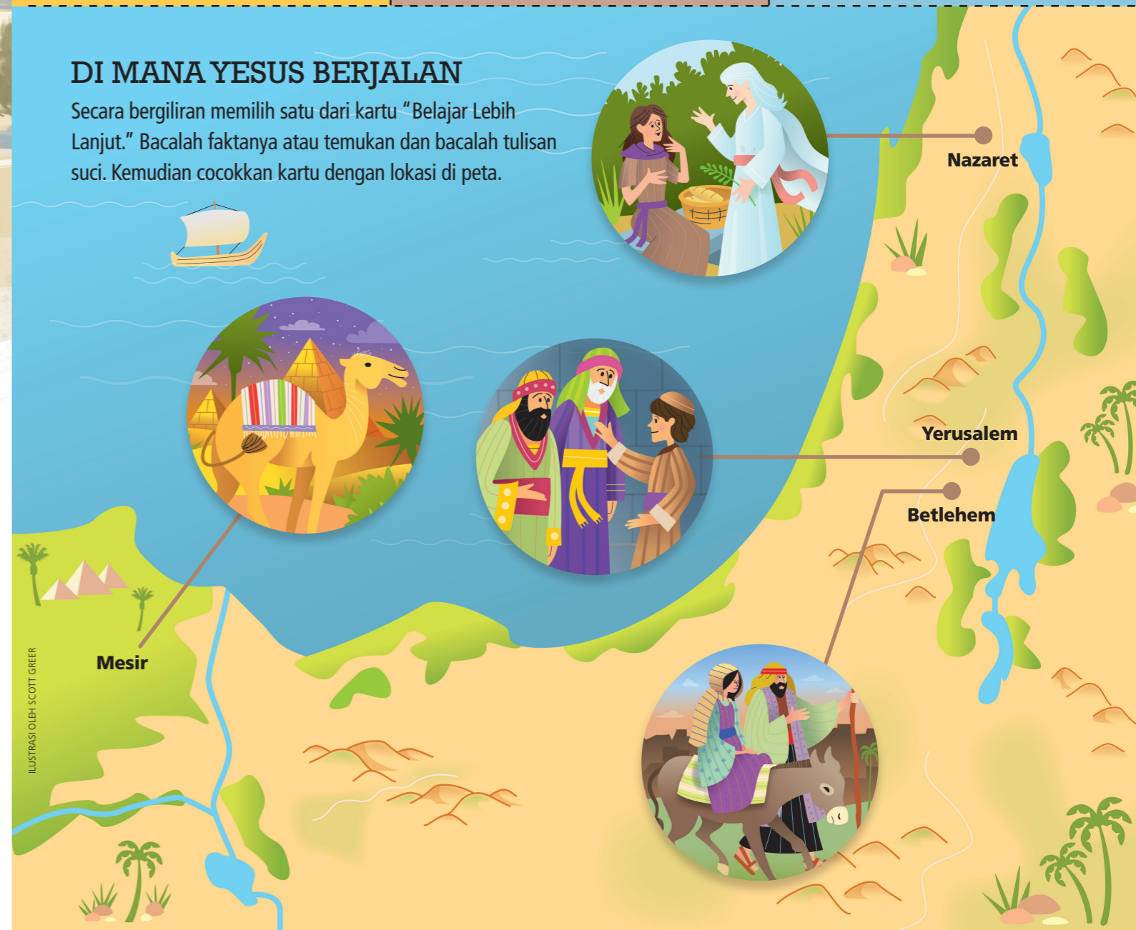
ILUSTRASI OLEH DAVID MALAN

Secara bergiliran memilih satu dari kartu "Belajar Lebih Lanjut." Bacalah faktanya atau temukan dan bacalah tulisan suci. Kemudian cocokkan kartu dengan lokasi di peta.