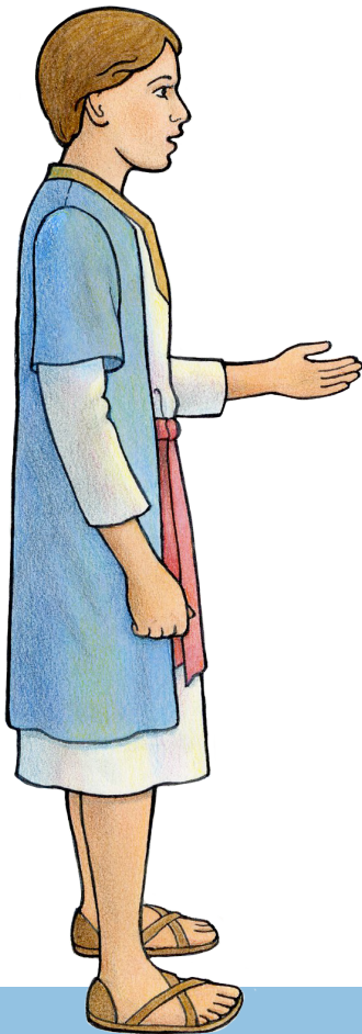
Sīsū, 'i hono ta'u 12

Te ke lava 'o paaki ha ngaahi tatau lahi ange 'i he liahona.lds.org .