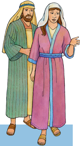
Mele mo Siosefa