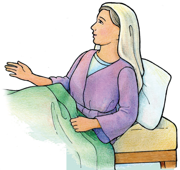
Soacra lui Petru