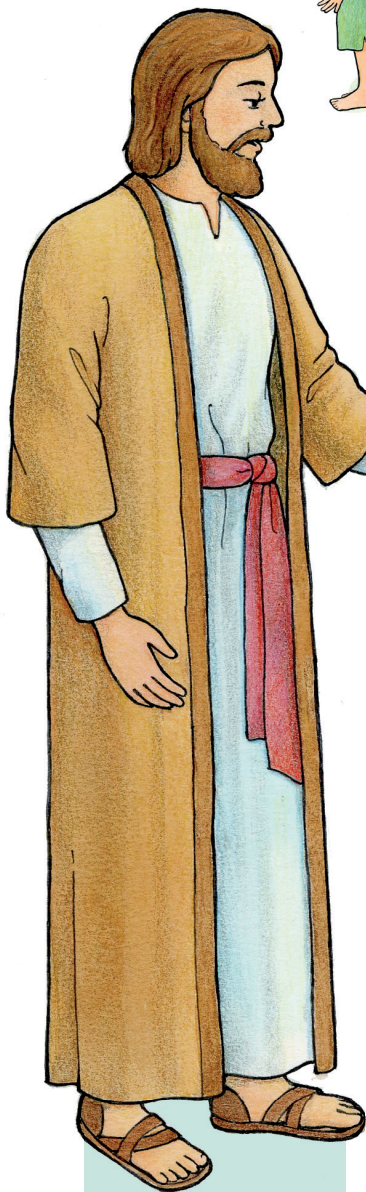
Chúa Giê Su Ky Tô

Các em có thể sao thành nhiều bản tại liahona.lds.org .