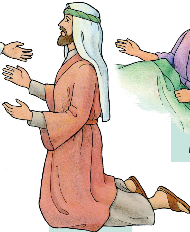
Người Mắc Bệnh Phung