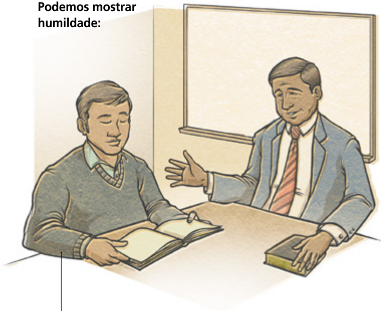
Recebendo conselhos e correção.