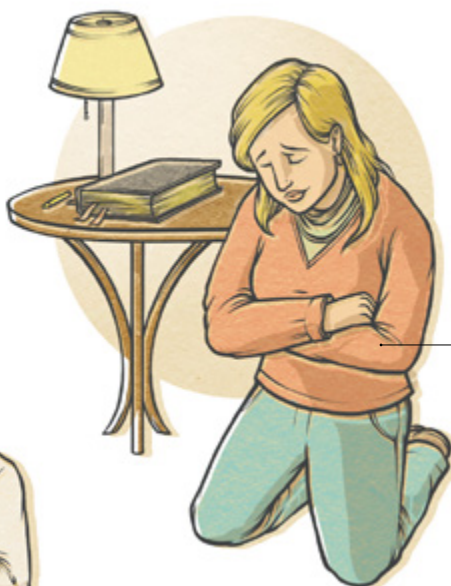
Orando com real intenção.