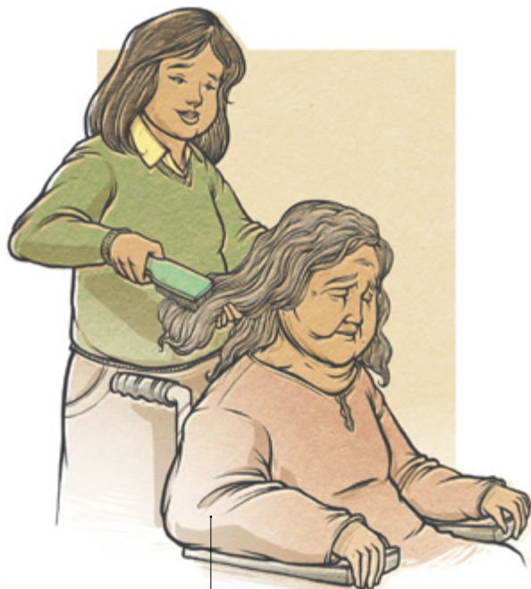
Prestando serviço abnegado.