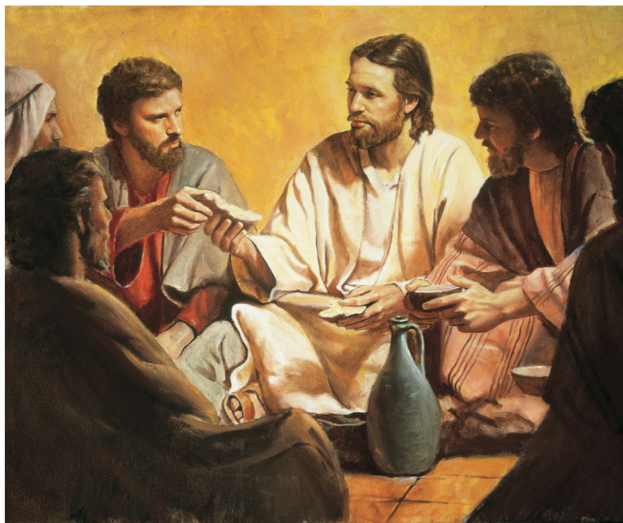
À GAUCHE : LE CHRIST INSTAURE LA SAINTE-CÈNE PARMI LES APÔTRES, TABLEAU DE DEL PARSON ; À DROITE : DÉTAIL DU TABLEAU DE HARRY ANDERSON JÉSUS-CHRIST ; IMAGE DU CHRIST, TABLEAU DE HEINRICH HOFMANN, REPRODUIT AVEC LA PERMISSION DE C. HARRISON CONROY CO., INC.