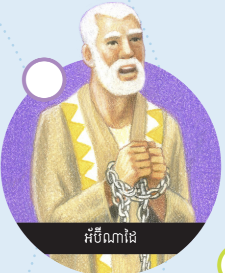
អ័ប៊ីណាដៃ