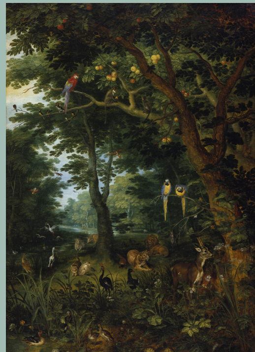
En el Edén, todas las cosas fueron creadas en un estado paradisiaco: sin muerte, sin procreación, sin experiencias probatorias.