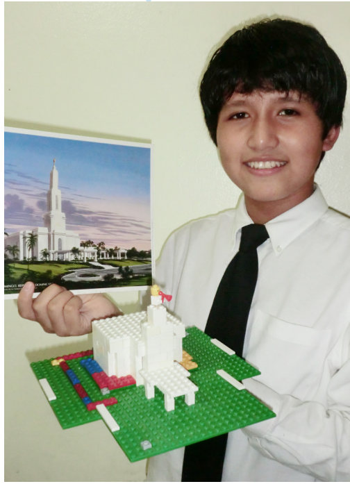
Na ou fausia se ata faataitai o le Malumalu o Santo Domingo Dominican Republic i piliki meataalo.