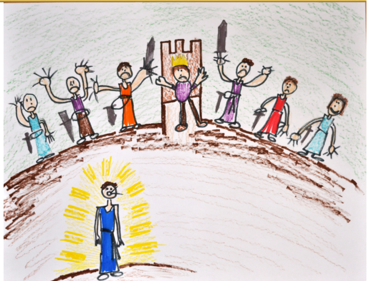
Brooks L., edad 8, Florida, USA