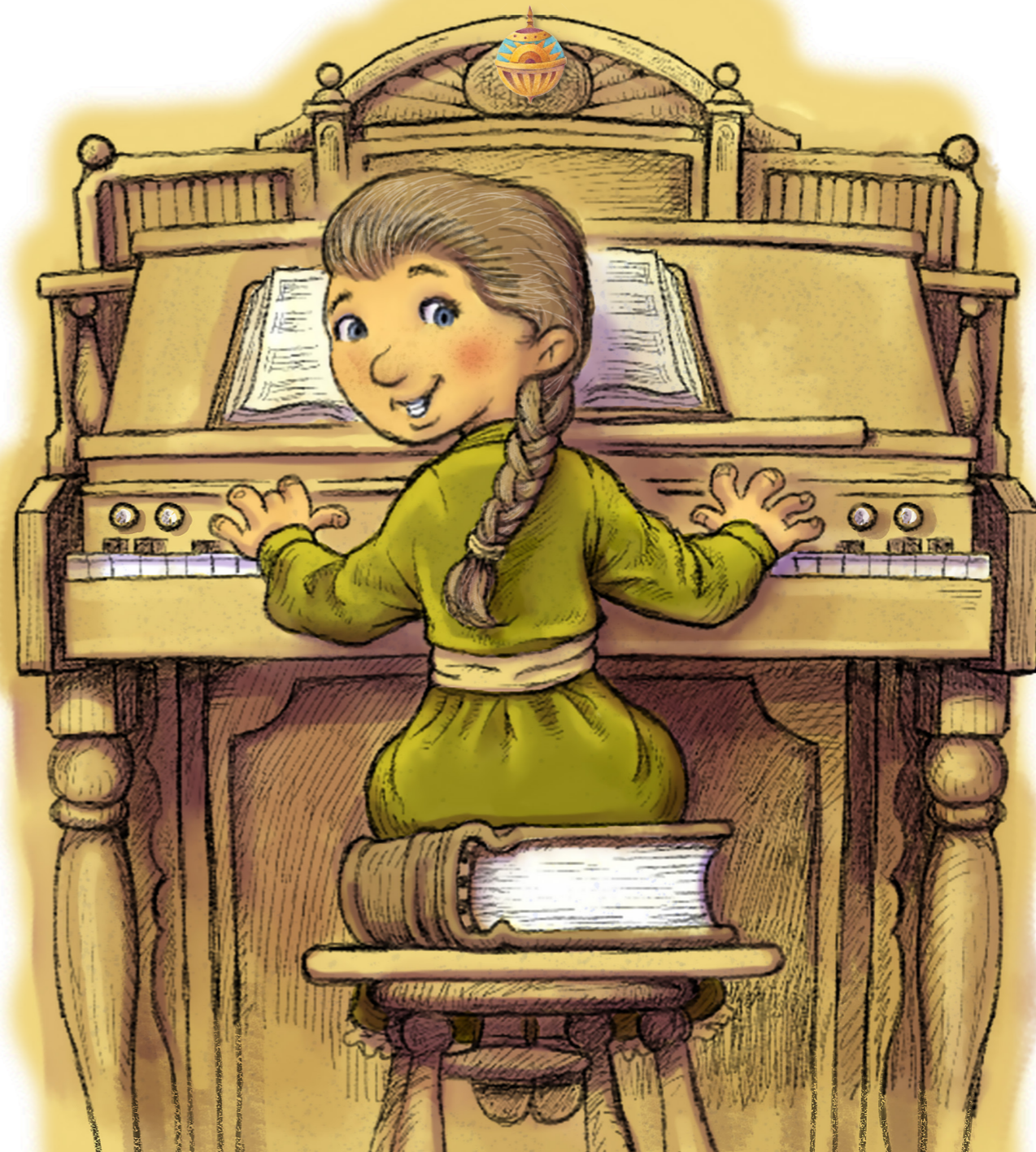
ภาพประกอบโดย แมวทาสี