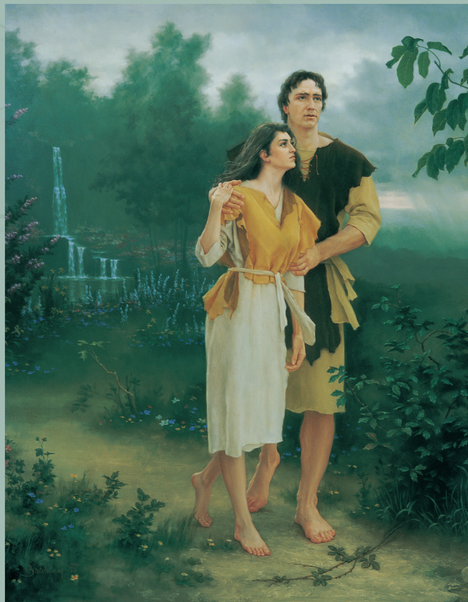
Адам и Ева покинули свое состояние бессмертия и райской славы, чтобы пройти испытательный срок на Земле. Это событие называется Падением.