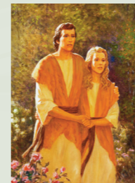
СЛЕВА: ЕДЕМСКИЙ САД. С КАРТИНЫ ЯНА БРЕЙТЕЛЯ-СТАРШЕГО © ВРК, БЕРЛИН/ТЕМАЛПАДЕГАЛЕРИЙОРГ П. - АНДЕРСАРТ RESOURCE. NY, ИЗДАНИЕ ИЗ САДА ЕДЕМСКОГО, С КАРТИНЫ ДЖОЗЕФА БРИККИ, СТРАВА: ФРАГМЕНТ КАРТИНЫ ЭРИ КЭЛПА АДАМ И ЕВА ИЗГНАНЫ ИЗ САДА ЕДЕМСКОГО, ФРАГМЕНТ КАРТИНЫ ГАРРИ АНДЕРСОНА ХРИСТОС В ГЕФСИМАНИИ, ВОСКРЕСЕНИЕ, С КАРТИНЫ ГАРРИ АНДЕРСОНА.