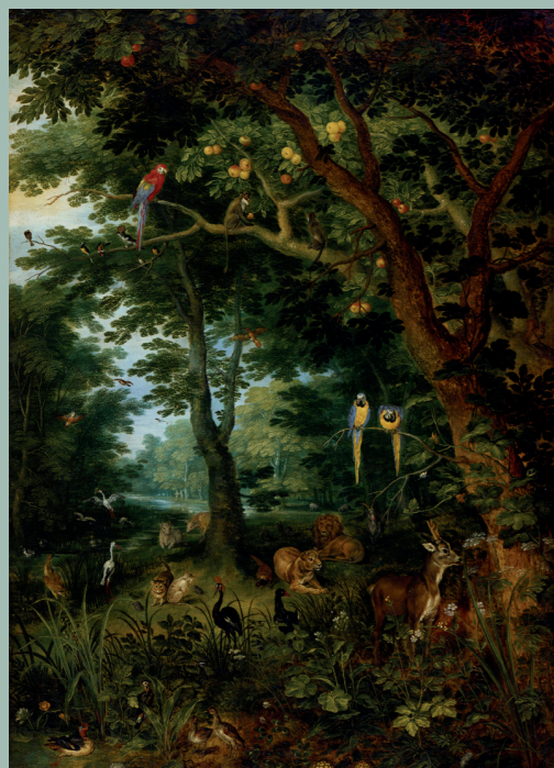
エデンでは、 万物がパラダイスの状態に 創造されました。 そこでは、死も、 子供をもうけることもなく、 肉体における試しの経験も ありませんでした。