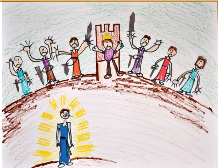
ブルックス・L, 8才 (アメリカ合衆国, フロリダ州)