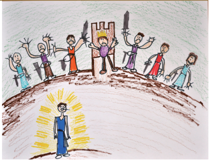
브룩스 엘, 8세, 미국 플로리다 주