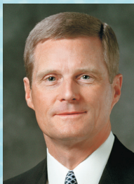
От старейшина Дейвид А. Беднар