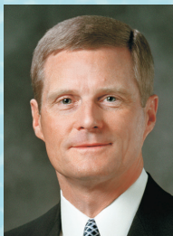
Írta: David A. Bednar elder A Tizenkét Apostol Kvórumából