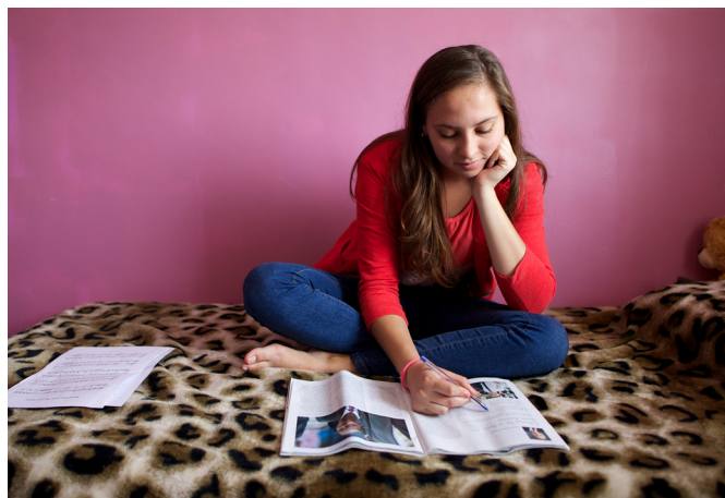
FOTOGĀFIJA POŽĒJA MODELE

Atbilde man nāca nākamajā dienā, lasot vispārējās konferences runu žurnālā Liahona . Man bija sajūta, it kā Debesu Tēvs man teiktu, ka Viņš nevar izdarīt izvēli manā vietā, — tas bija lēmums, kas bija jāpieņem man pašai. Es zināju, ka neatkarīgi no tā, ko es izvēlēšos, man būs smagi jāstrādā, lai gūtu panākumus.