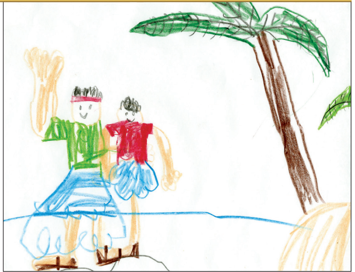
Damon B., 8 let, Utah, ZDA